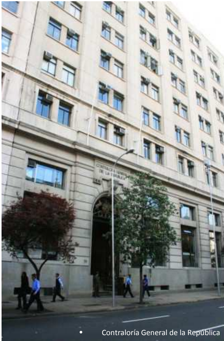
• Contraloría General de la República