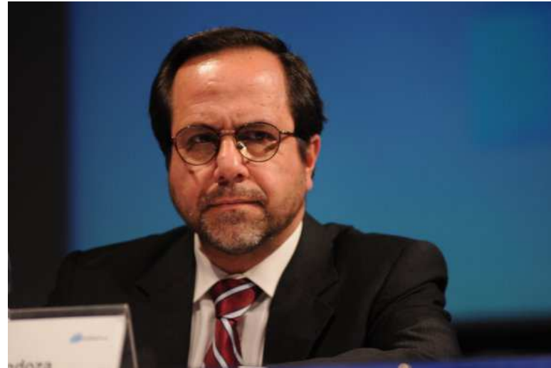
• Ramiro Alfonso Mendoza, Contralor General de la República